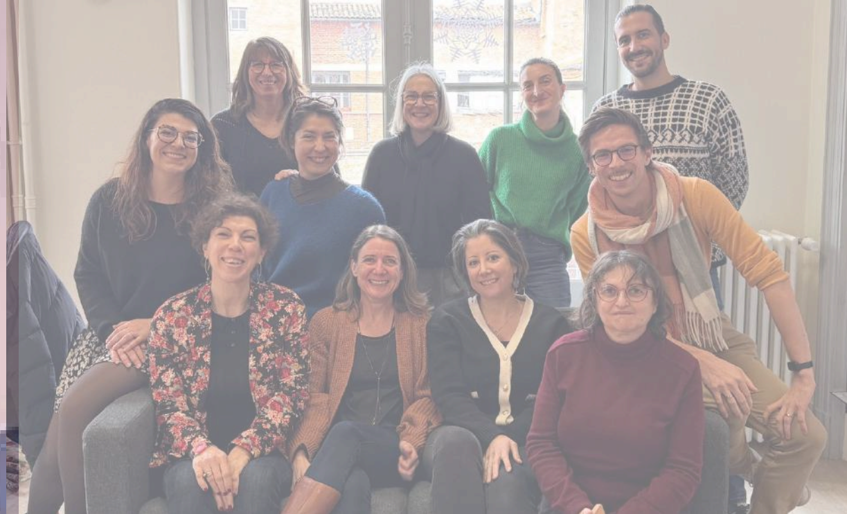
Plate-forme régionale d'appui interministériel à la gestion des ressources humaines